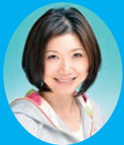
ゲストランナー 市橋有里さん

世界陸上セビリア大会 女子マラソン銀メダリスト シドニーオリンピック 女子マラソン代表